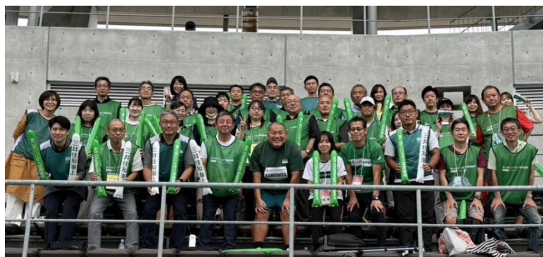
<グループ一体応援の様子>

また、所属アスリートやスポーツ振興活動に関する情報の発信に特化したWebサイトやSNSを開設するなど、スポーツ・パラスポーツの魅力発信をさらに強化しています。