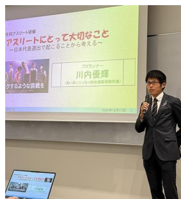
<アスリート合同研修風景>