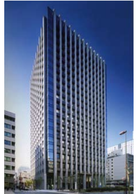
MS&ADホールディングスが入る 八重洲ファーストフィナンシャルビル

今後も、スピード感を持って事業基盤および経営資源の強化・拡大を図ることにより、グローバルに事業展開する世界トップ水準の保険・金融グループを創造し、持続的な成長と企業価値の向上を目指します。